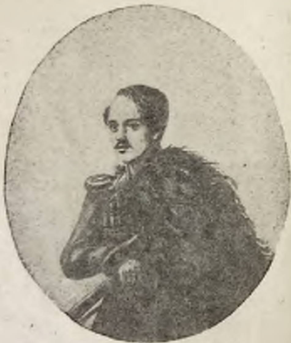
М. Ю. Лермонтов в 1837 году. С акварельного портрета, исполненного самим поэтом.